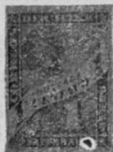
Sep. P 3

1896. Sp. P 3. Litografiadas como las anteriores, pero en colores más vivos en opacidad, papel amarillo paja; perforadas 13 1/2.